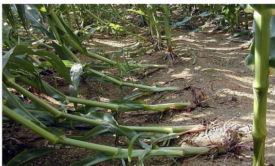
Atac la radacina

Viermii sârmă - sunt larve de gândaci din ordinul Coleoptera (familia Elateridae). Insecta adultă este de culoare maronie spre negru, are o lungime a corpului de până în 15 mm. Insecta adultă nu este dăunătoare pentru plante. Pagubele agricole sunt produse de către larvele insectei. Larva este de culoare portocalie înspre galben și are o lungime a corpului de până la 25 mm în funcție de vârstă și de stadiul de dezvoltare. Larvele au un corp puternic chitinizat și datorită acestui caracter rigid ei au primit denumirea populară de “viermi sârmă”. Din vârsta a doua, culoarea corpului se transformă din alb-transparent în galben-portocaliu lucios, iar capul este brun. Larvele sunt extrem de vătămătoare, hrănindu-se cu părțile subterane ale plantelor, cu boabele în curs de germinare, embrionul sau rădăcinile abia formate.