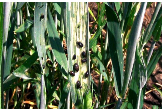
Atac larve pe frunza

Pentru combatere , va recomandam tratamentul fitosanitar utilizand unul din produsele de mai jos: