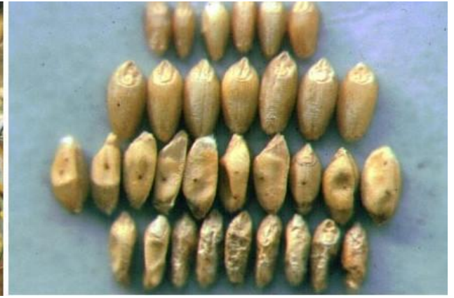
Boabe de grau atacate

Gandacul balos al ovazului – Prezintă o generație pe an. Ierneză ca insectă adultă sub ierburi, gunoaie, în frunzarul pădurilor. Apar în primăvară, când temperatura medie zilnică este de 9-10°C, în aprilie. La apariție insectele se hrănesc perforând frunzele sub formă de dungii longitudinale.