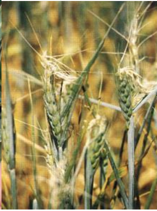
Atac pe spic