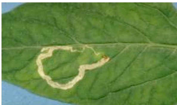
Atac pe frunza