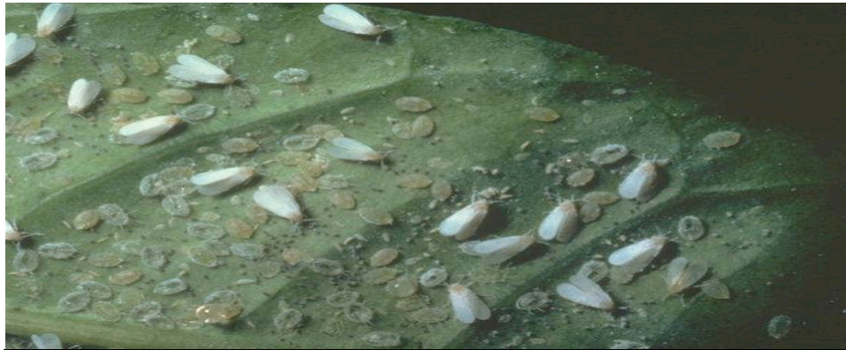
Musculița albă de seră în diferite stadii de dezvoltare