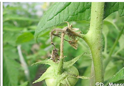
Simptome pe inflorescenta