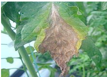
Leziuni pe frunze

Un simptom neobișnuit, pe fructe, îl reprezintă apariția de halouri, numite "pete fantomă". În centrul acestor halouri apar puncte mici, necrotice. Haloul este de culoare albă, circular, de 3-8 mm în diametru. Un număr mare de halouri pe fructe face ca acestea să aibă un aspect neplăcut și să fie greu de comercializat.