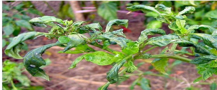
Atac pe tomate