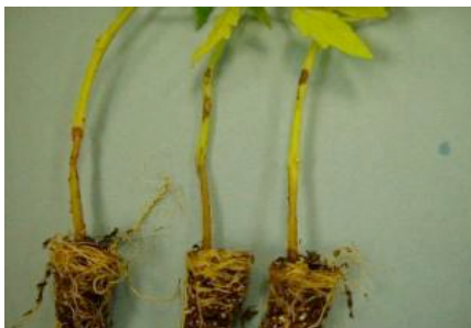
Cancere pe tulpini