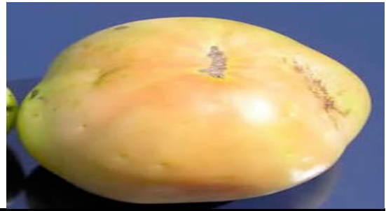
Atac pe fruct