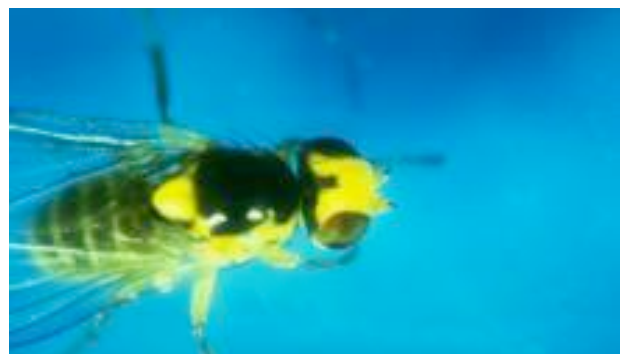
Adult ( femela)