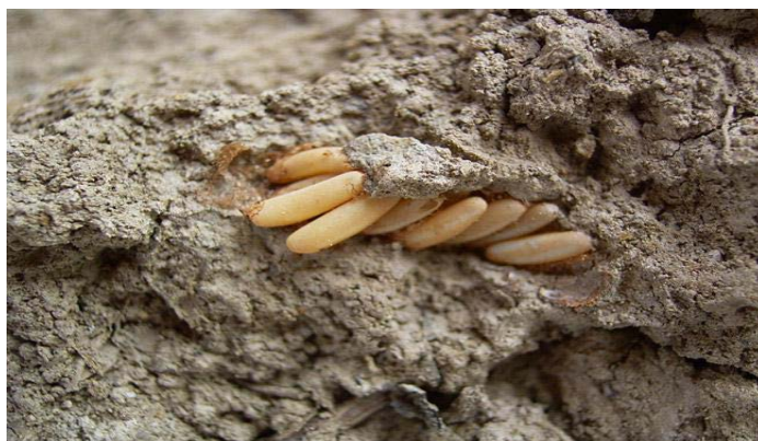
Oua depuse in sol